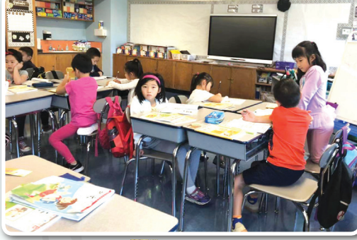
开学第一天学生们在上课