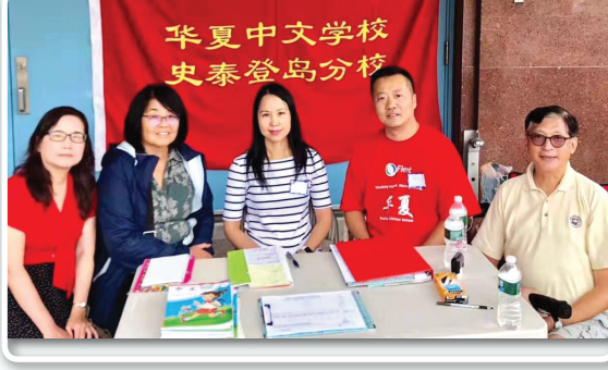
学校新老校长及财务主管