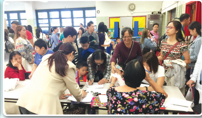
开学当天注册的学生及家长们