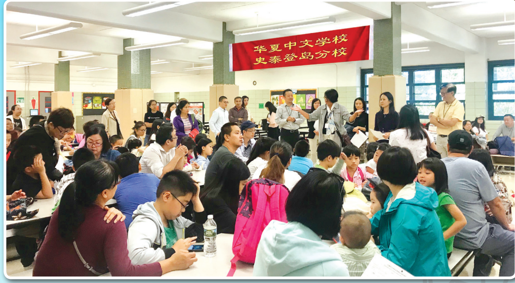
开学当天, 华夏中文学校史泰登岛分校老师热烈欢迎学生和家长们来参加开学典礼

华夏中文学校史泰登岛分校成立于2002年, 是纽约市唯一一家华夏分校, 也是史泰登岛最大的非营利华文教育机构。同时也是所有喜欢中国文化的华裔及非华裔家庭学习了解中国文化的重要平台。学校以教授中文拼音及简体中文字为主。使用暨南大学《幼儿汉语》、《汉语拼音》和《中文》教材。注重培养学生的听说读写综合能力。在教授中文的同时, 学校还开设了武术、画画、象棋、手工及瑜伽等文化兴趣课。2019年秋季学期注册仍然开放, 欢迎家长带适龄儿童前来报名学习中文及各种文化课!