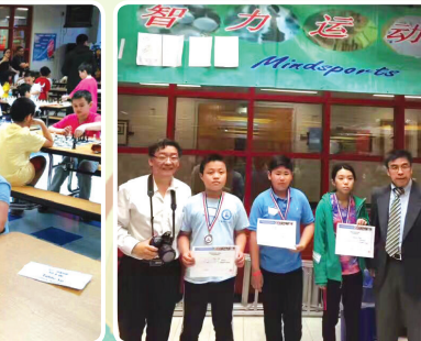
华夏总校智力运动会