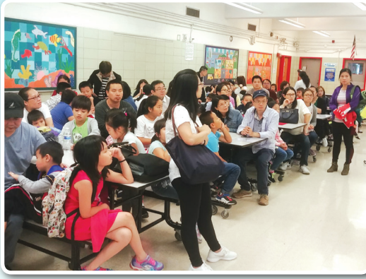
开学当天, 学生和家长们参加开学典礼