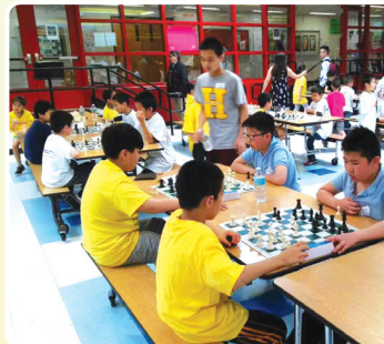
华夏总校智力运动会