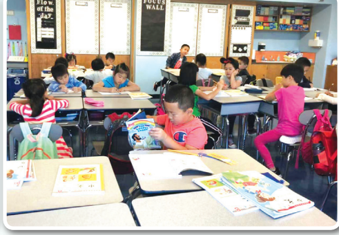
开学第一天学生们在上课