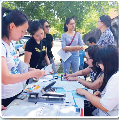
开放日当天现场注册报名